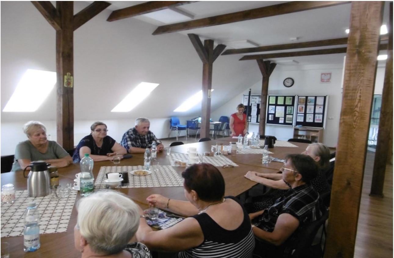
Cykl spotkań z dietetykiem w Klubie „SENIOR+” – sierpień 2023 r.