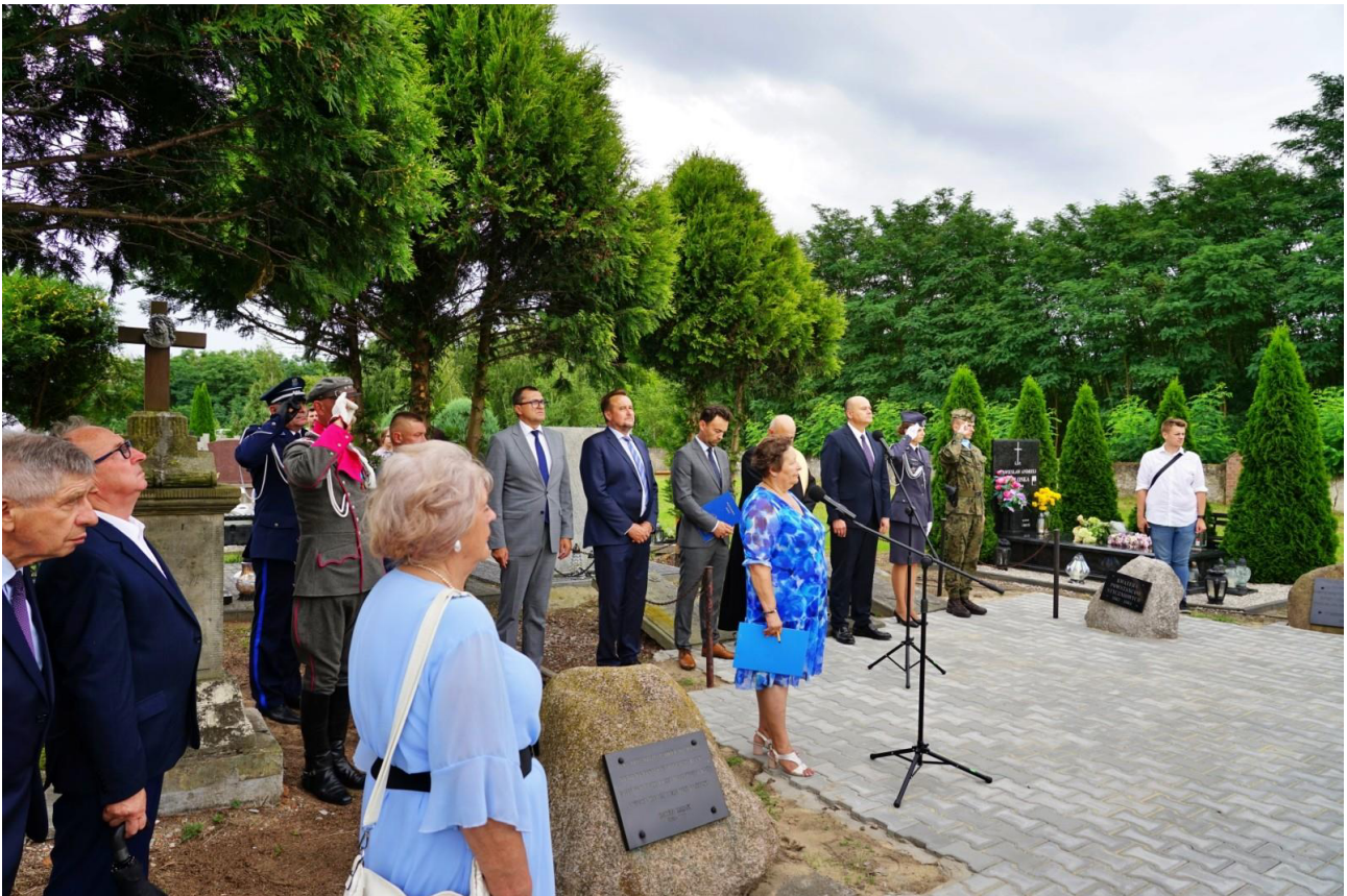
Uroczystości w Oleksowie upamiętniające bohaterów walczących o wolność ojczyzny w czasie powstania listopadowego, styczniowego oraz I i II wojny światowej – 06.08.2023r.