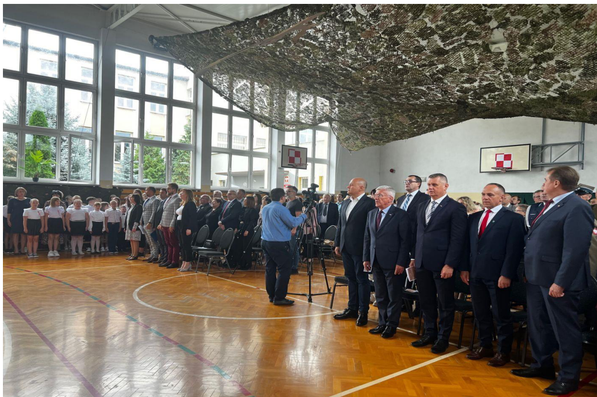
Uroczystość nadania Publicznej Szkole Podstawowej w Gniewoszowie im. Lotników Ziemi Gniewoszowskiej – 24.09.2023 r.