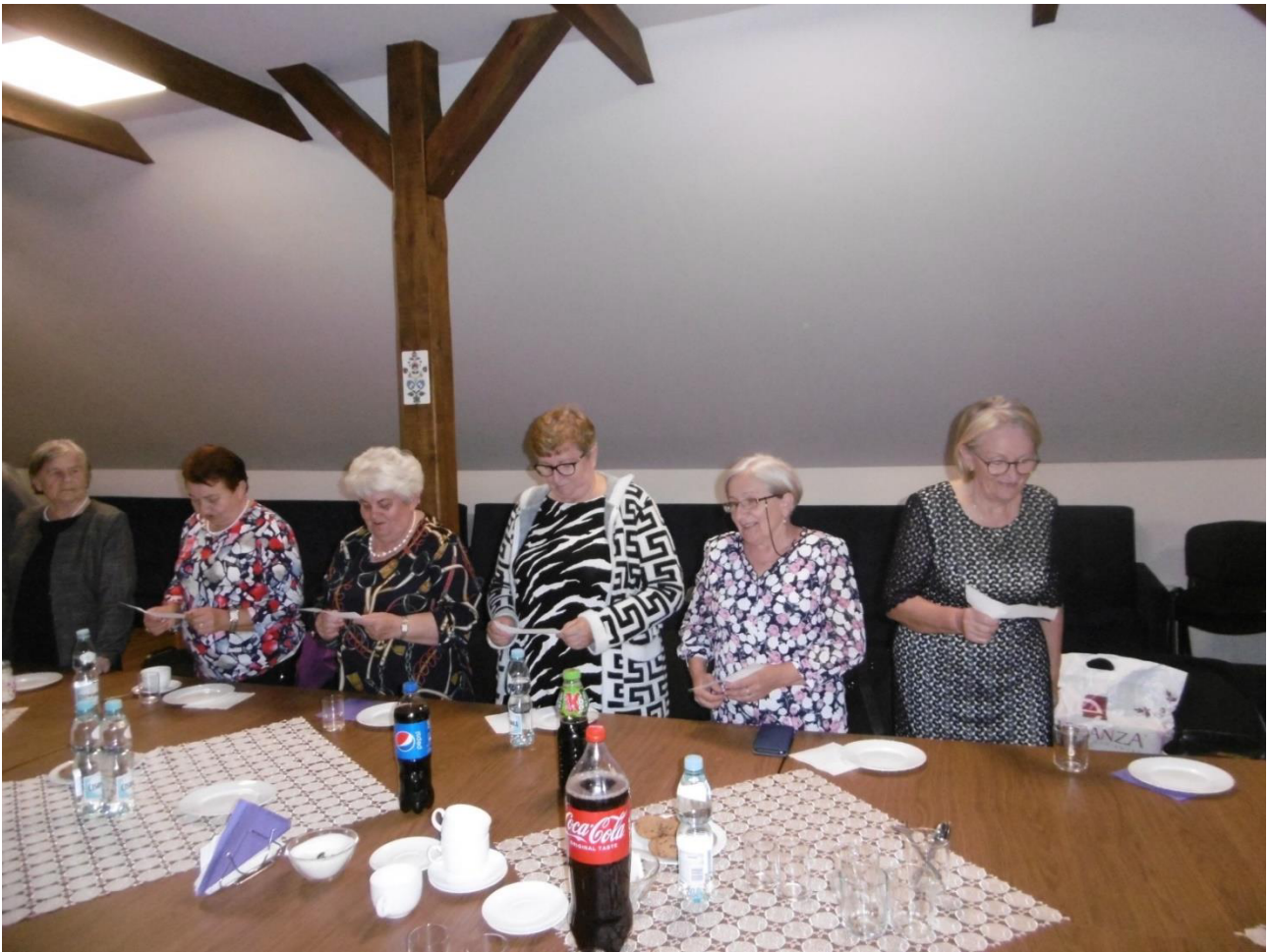
Dzień Chłopaka w Klubie „SENIOR+” – 01.10.2023 r.