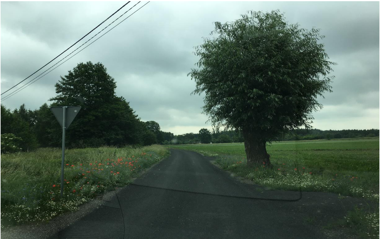
„Przebudowa odcinka drogi w miejscowości Sarnów” (wzdłuż torów kolejowych w kierunku wschodnim od drogi wojewódzkiej nr 788)

Przebudowa odcinka drogi w miejscowości Sarnów-I,(od drogi wojewódzkiej 788 do posesji nr 127) cena brutto: 83 809,25 zł.