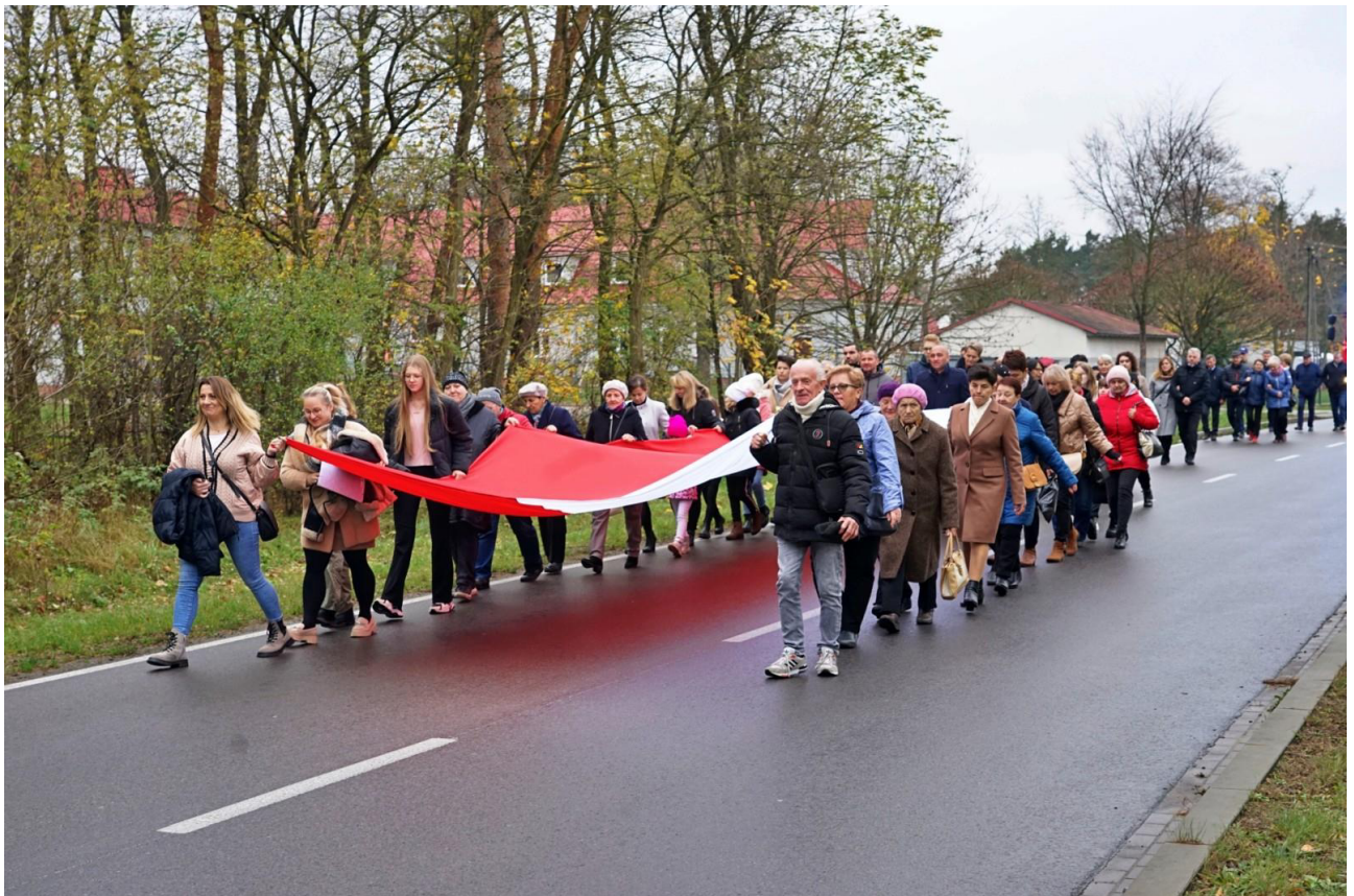
105 rocznica odzyskania przez Polskę niepodległości – 11.11.2023r.