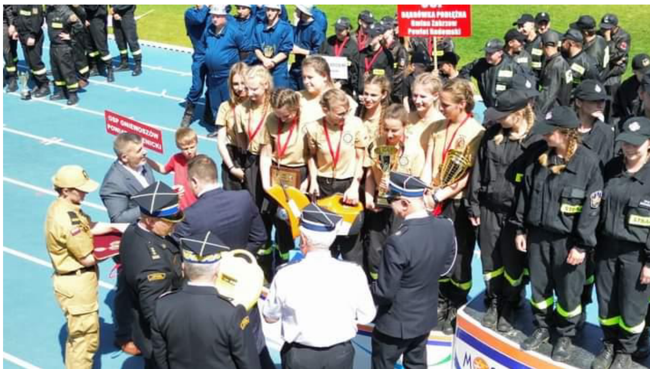
VII Wojewódzkie Zawody Sportowo – Pożarnicze Ochotniczych Straży Pożarnych w Mławie -10.06.2023r.