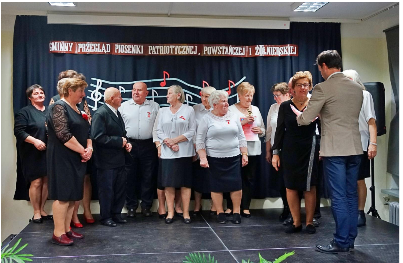
VII Gminny Przegląd Piosenki Patriotycznej, Powstańczej i Żołnierskiej Gniewoszków 2023 – 10.11.2023r.