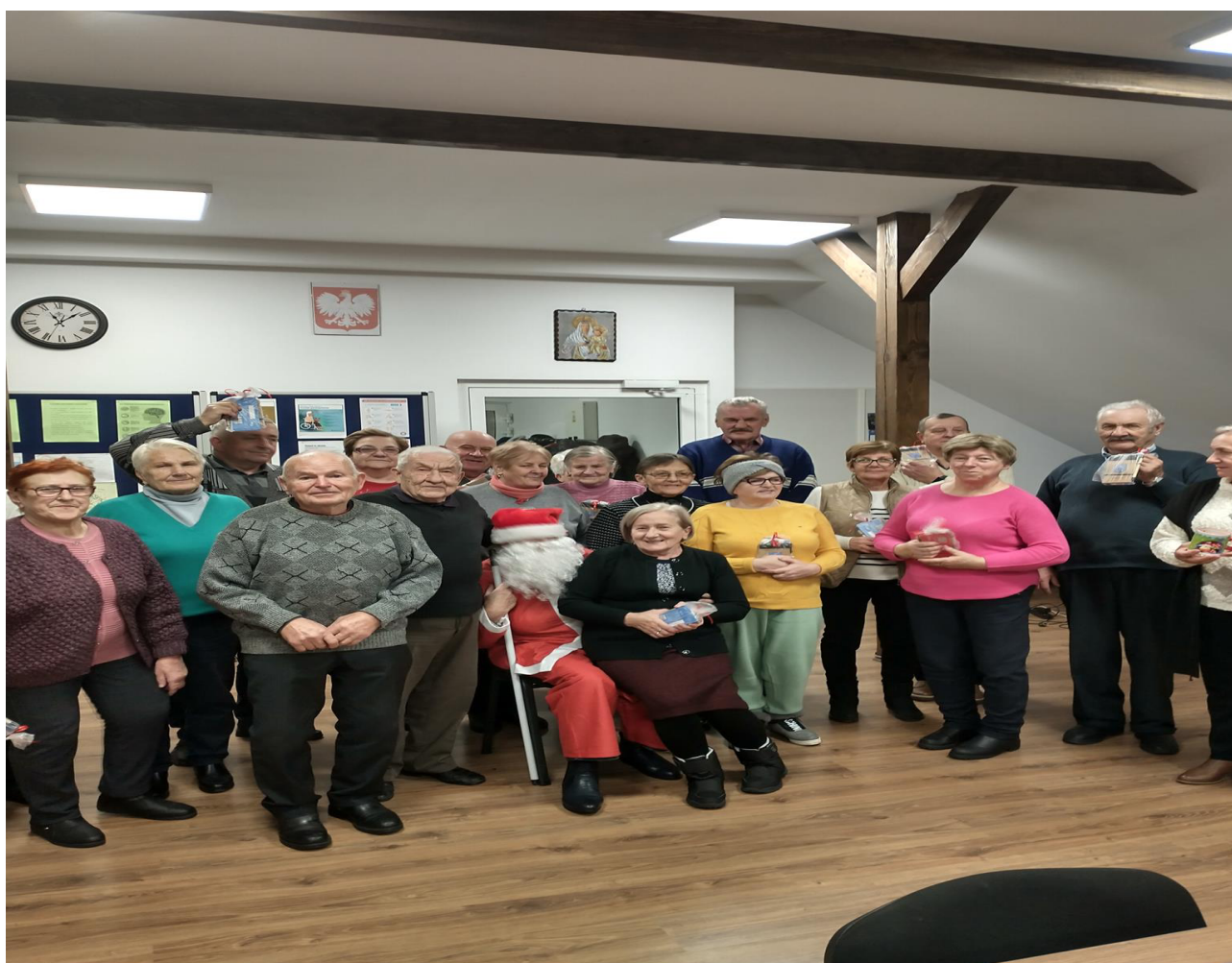
Mikołajki w Klubie „SENIOR+” -6.12.2023 r.

Klubowicze rozwijają również własne zainteresowania i zdolności artystyczne: szydełkowanie, haftowanie, robienie na drutach i inne według własnych upodobań.