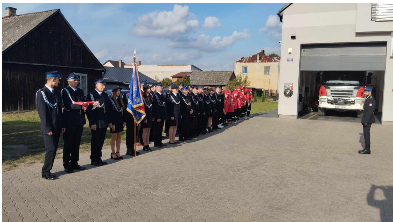
Uroczystość przekazania jednostkom OSP pojazdów pożarniczych – 13.10.2023r.