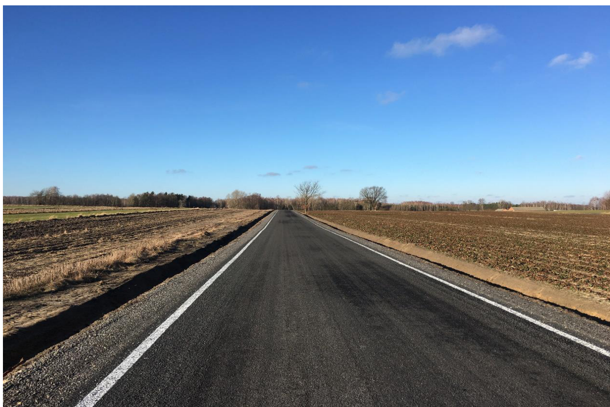
Przebudowa odcinka drogi w miejscowości Markowola.

Przebudowa odcinka drogi w miejscowości Gniewoszów (ul. Dolna), cena brutto: 319 240,35 zł.