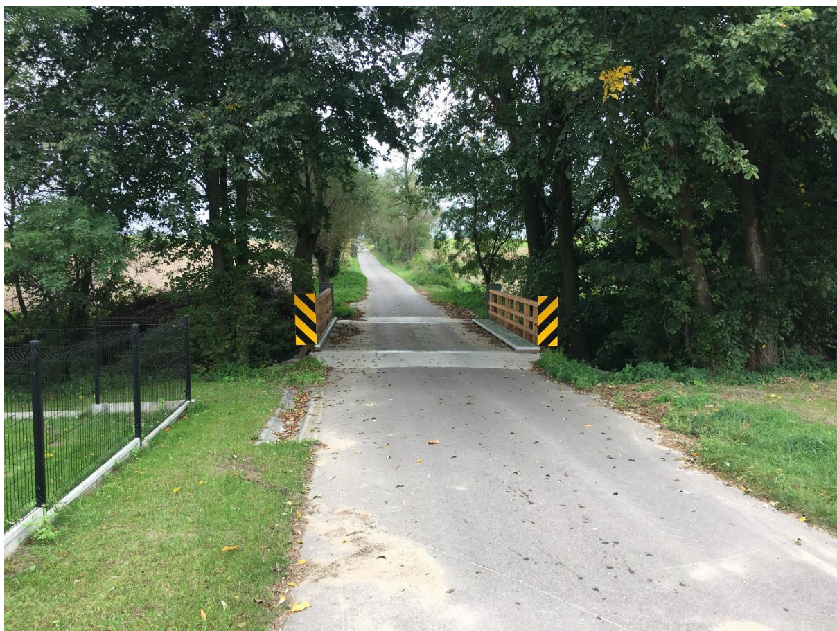
Most w Boguszówce po remoncie