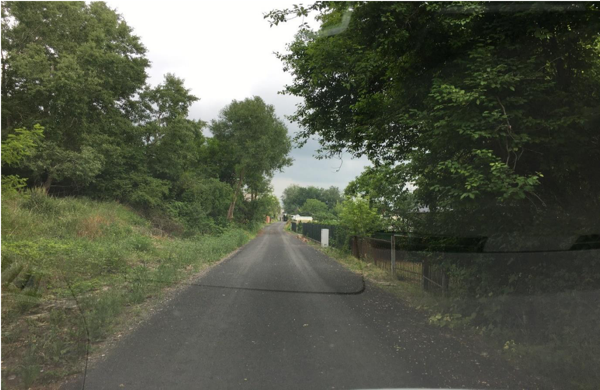
Przebudowa odcinka drogi w miejscowości Gniewoszów (ul. Dolna)

Przebudowa odcinka drogi w miejscowości Sarnów” (wzdłuż torów kolejowych w kierunku wschodnim od drogi wojewódzkiej nr 788), cena brutto: 274 940,67 zł.