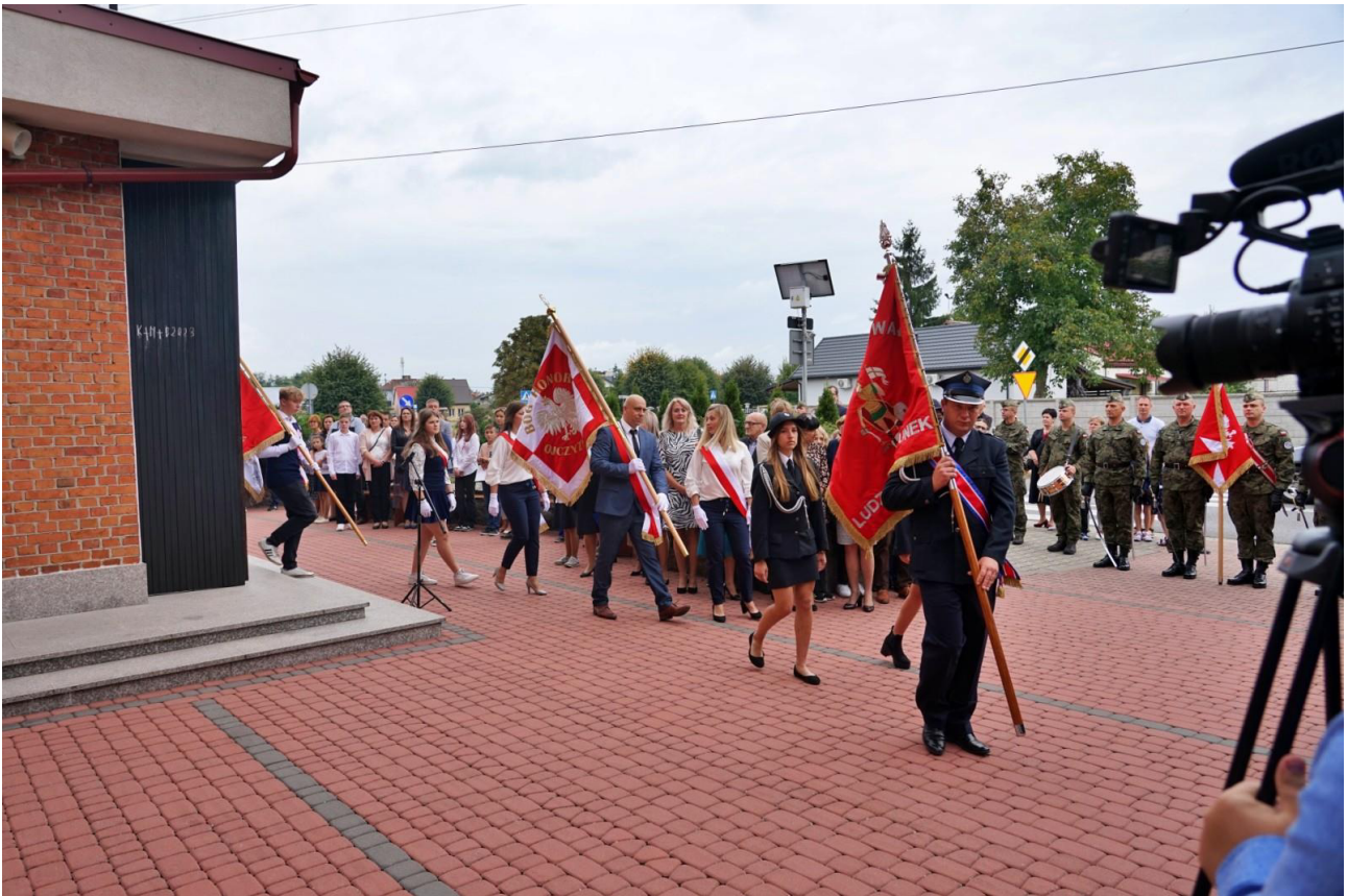
Uroczystości ku czci Lotników Ziemi Gniewoszewskiej – 24.09.2023r.