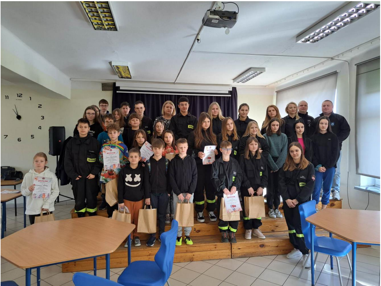
Ogólnopolski Turniej Wiedzy Pożarniczej pn. „Młodzież zapobiega pożarom” - 01.03.2023r.