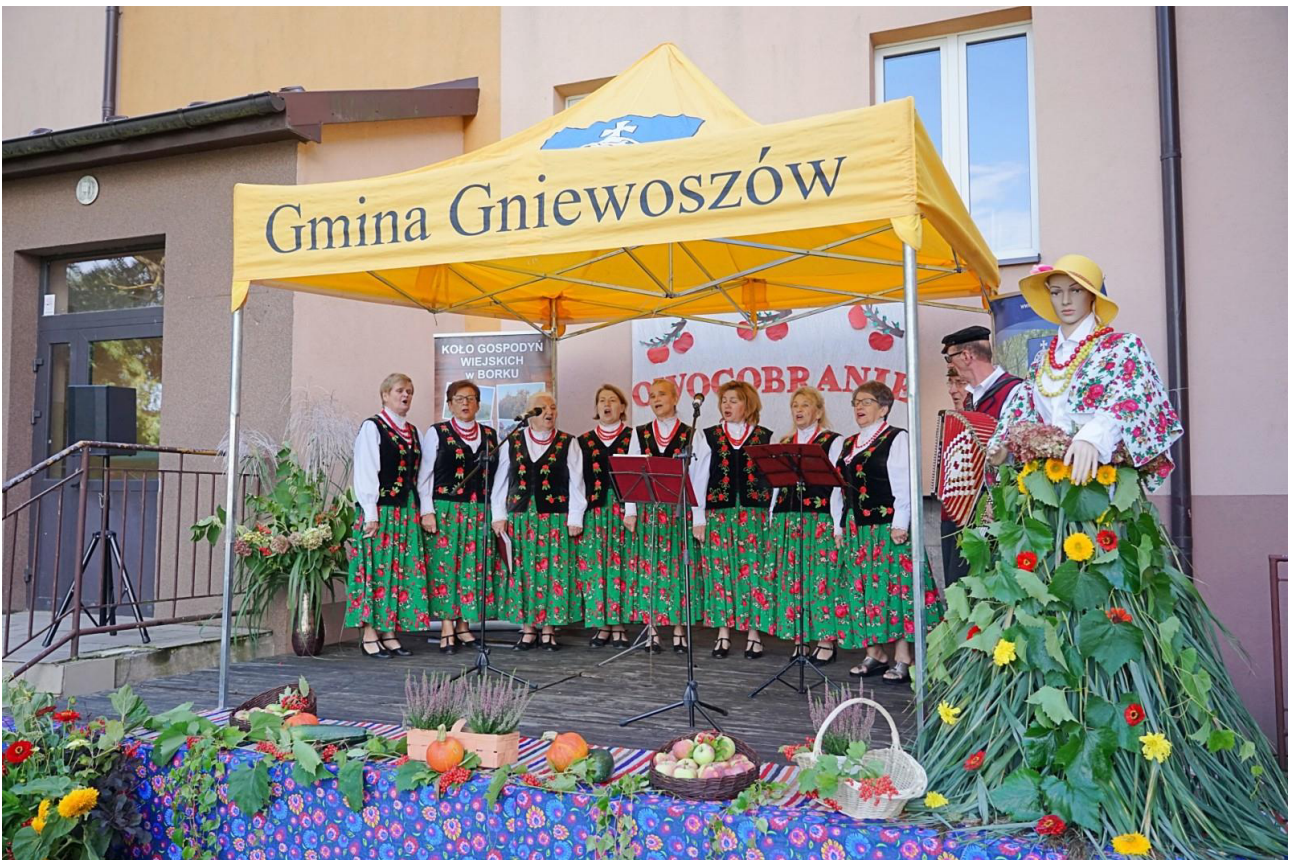
„Owocobranie” w Borku – 03.09.2023r.