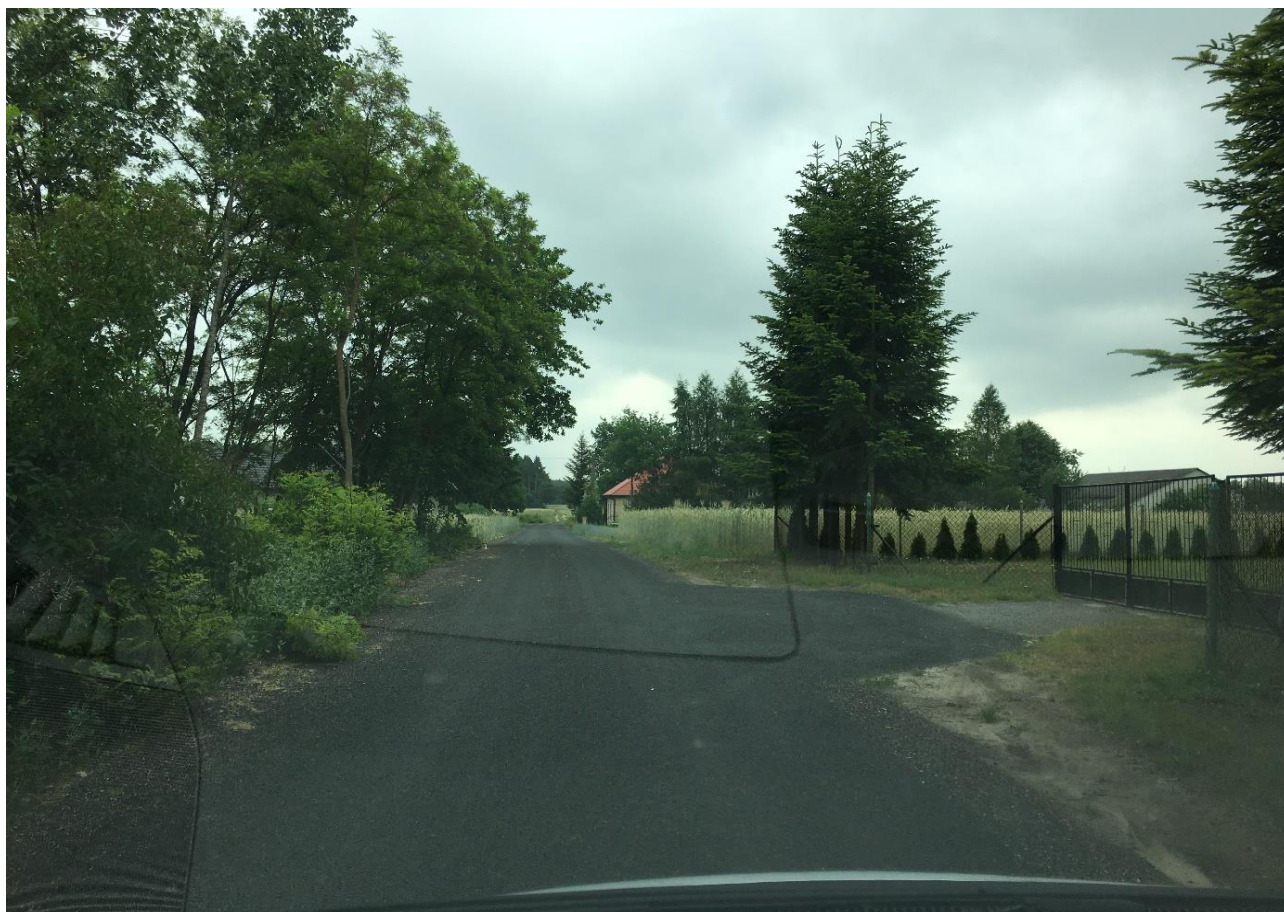
Przebudowa odcinka drogi w miejscowości Sarnów-I, (od drogi wojewódzkiej 788 do posesji nr 127)