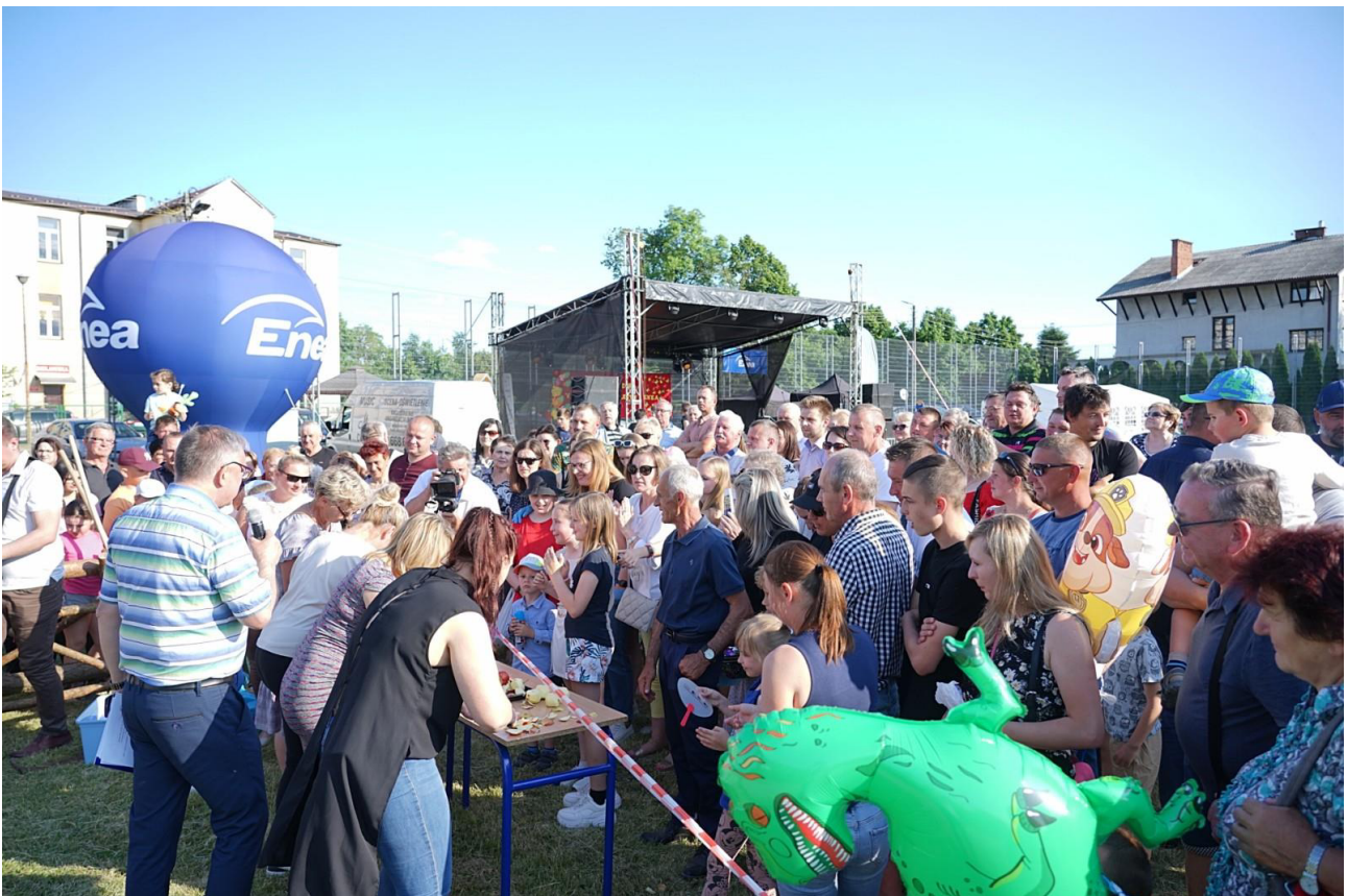
Festyn Rodzinny z okazji Międzynarodowego Dnia Dziecka oraz V Spartakiada Solectw z ENEC – 04.06.2023r.